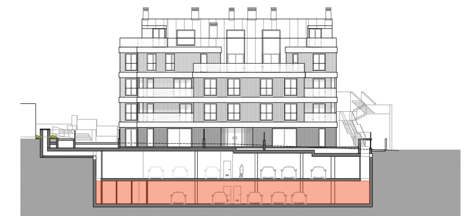
SECCIÓN LONGITUDINAL (POR CALLE CENTRAL)